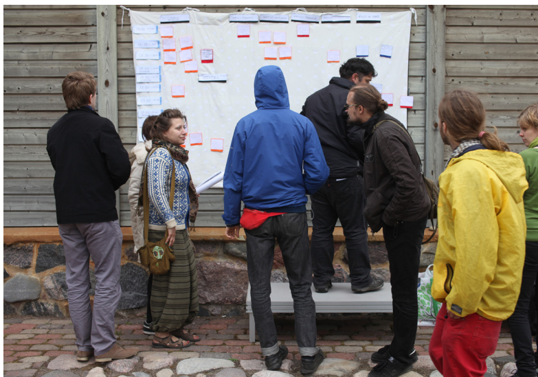
Omari küün. Kava koostamine vildist exceliga.