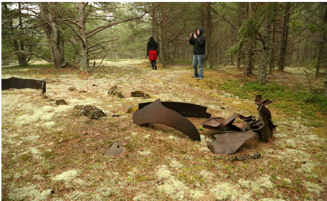
Naissaar. Ekspeditsioon loodusesse militaarruude vahele.