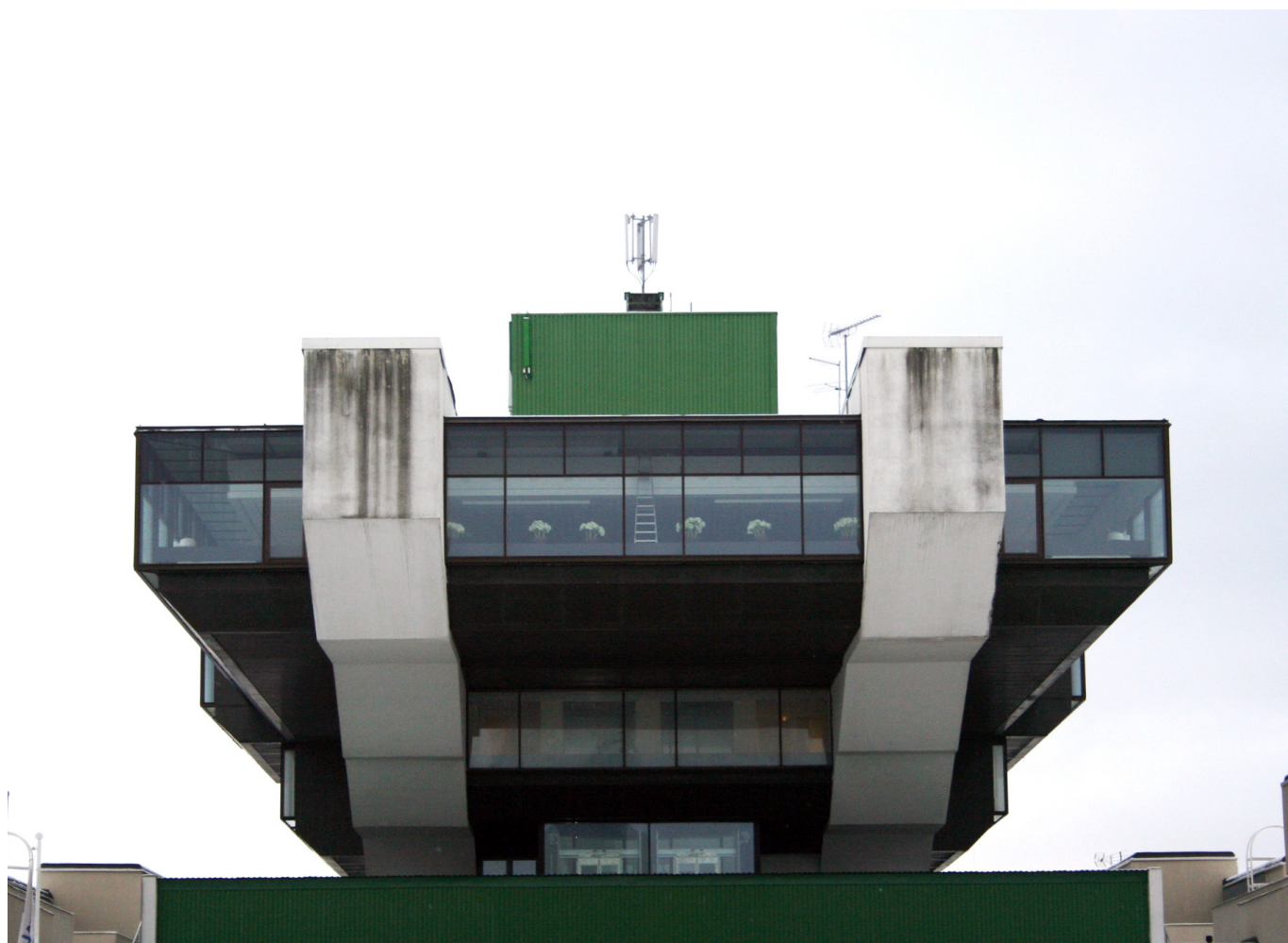
Tallinna Olümpia Purjesportikeskus.