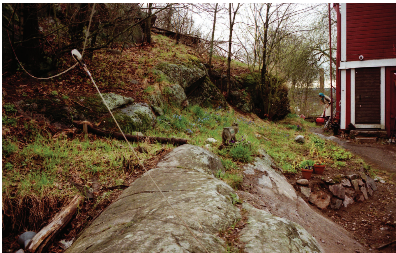
HOONETEGA VAHELDUVAID GRANITIKALAJUJ