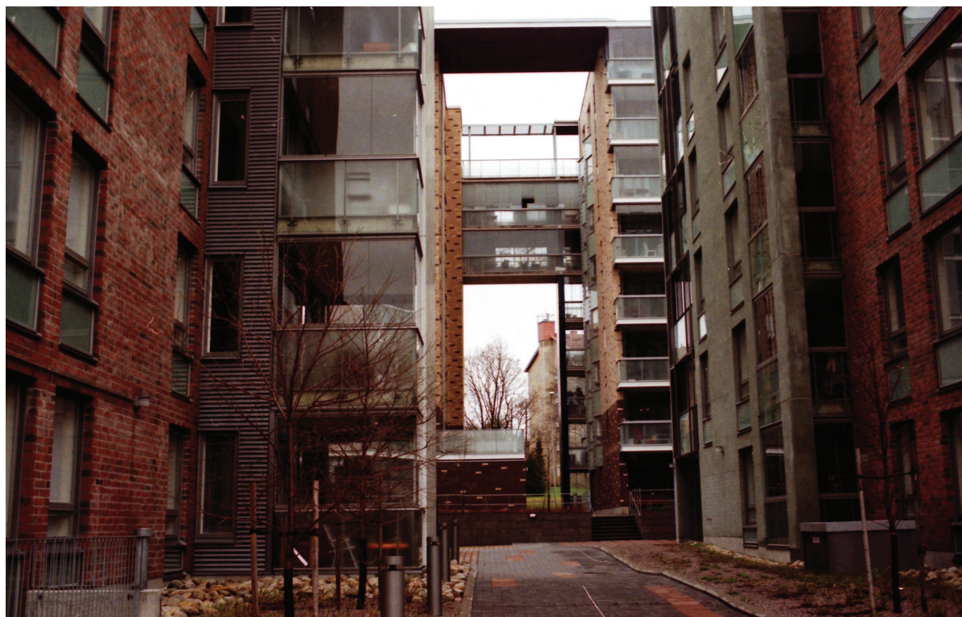
ÜKS HELSINGI ELAMISVIISIDEST