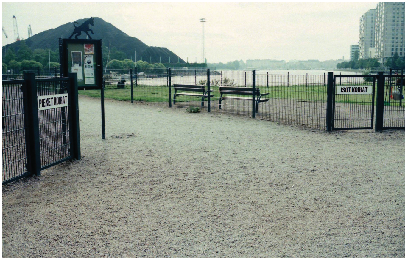
KAS SUL ON SUUR VÕI VÄIKE KOER?